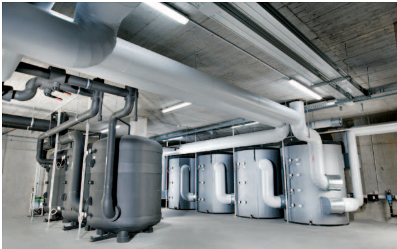
Speichersystem für Kälte (links) und Wärme (rechts)

werden über Wasserbecken mit einem Volumen von jeweils 40 m 3 versorgt. Die darin gebundene Wärme wird über Wärmepumpen in ein höheres Temperaturniveau umgewandelt und in großen Wasser-Pufferbehältern (Wärme 16 m 3 , Kälte 12 m 3 ) gespeichert. Je nach erforderlichem Heiz- oder Kühlfall wird auf die jeweiligen Pufferspeicher zurückgegriffen. Da die reversiblen Wärmepumpen sowohl Wärme als auch Kälte erzeugen können, wird eine besonders hohe Leistungszahl erreicht. Diese wird auf größer sieben geschätzt. Die Kälte wird neben der Kühlung der Prozesse auch wesentlich zur Kühlung der Elektronikfertigung mit starken inneren Wärmelasten und einer Fläche von 700 m 2 benötigt. Die Raumtemperatur, die 24 °C nicht überschreiten sollte, müsste traditionell durch eine aufwendige Kühlanlage erzeugt werden. Diese kann nun gänzlich entfallen.