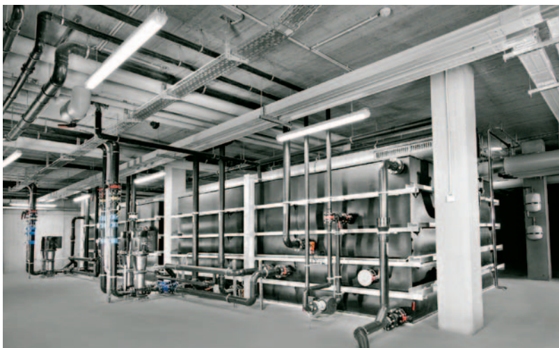
Kühlbehälter mit je 40.000 Liter für Kühlkreisläufe Kunststofffertigung

werden über Wasserbecken mit einem Volumen von jeweils 40 m 3 versorgt. Die darin gebundene Wärme wird über Wärmepumpen in ein höheres Temperaturniveau umgewandelt und in großen Wasser-Pufferbehältern (Wärme 16 m 3 , Kälte 12 m 3 ) gespeichert. Je nach erforderlichem Heiz- oder Kühlfall wird auf die jeweiligen Pufferspeicher zurückgegriffen. Da die reversiblen Wärmepumpen sowohl Wärme als auch Kälte erzeugen können, wird eine besonders hohe Leistungszahl erreicht. Diese wird auf größer sieben geschätzt. Die Kälte wird neben der Kühlung der Prozesse auch wesentlich zur Kühlung der Elektronikfertigung mit starken inneren Wärmelasten und einer Fläche von 700 m 2 benötigt. Die Raumtemperatur, die 24 °C nicht überschreiten sollte, müsste traditionell durch eine aufwendige Kühlanlage erzeugt werden. Diese kann nun gänzlich entfallen.