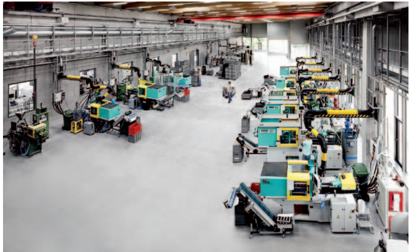
Neue Kunststofffertigung mit Medienstegen

WERMA stellt Kunststoffteile, Elektronik, Werkzeuge, Vorrichtungen und Anlagen selbst her – garantiert Made in Germany. Als weltweiter Innovationsführer investiert WERMA stark in die Entwicklung neuer Produkte. Mit einem dichten Vertriebsnetz ist das Unternehmen auf allen internationalen Märkten präsent.